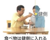
食べ物は健側に入れる

前回に続き食事介助です。今回は脳出血等の後遺症で片マヒのある方への介助方法です。片マヒの方の場合、座った状態でもマヒ側に倒れることがあるので、マヒ側に座って介助を行います(例外あり)。食べ物は、マヒ側に入れるとうまく飲み込めず口の中に残ることがあるので、健側(マヒのない側)に入れてください。パーキンソン病の方もどちらか一方は症状が軽いことが多いようです。症状の重い側に座り、食べ物を症状の軽い側の口に入れましょう。